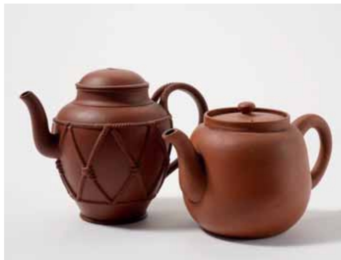
171 Twee Yixing theepotten met deksels