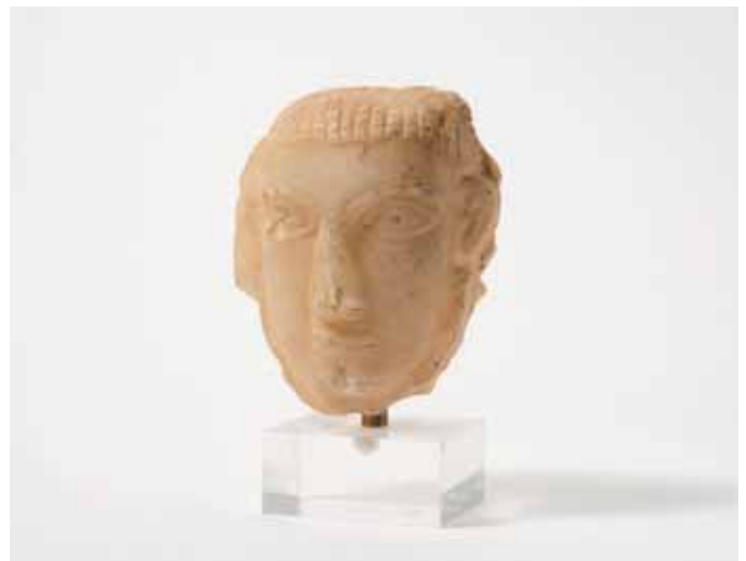
36 Een begrafenisportret van een vrouw Zuid-Arabië, circa 1e eeuw v. Chr.-1e eeuw na Chr. Calciet albast, gehakt uit lokaal albast. Op perspex sokkel. H. 15.8 cm (excl. sokkel) € 1.000 - 1.500