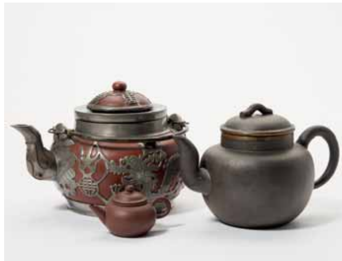
169 Drie Yixing theepotten met deksels