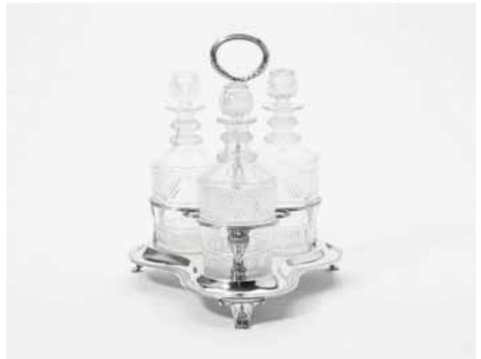
19 Een George III zilveren tafelstel