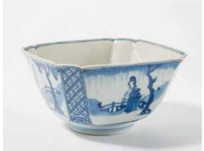
89 Een vierkante blauw-witte kom Kangxi Met afgeschuinde hoeken en een decor van lange lijnen in een tuin. In de bodem drie zotjes. Gemerkt Chenghua . Diam. 16.5 cm € 600 - 1.000