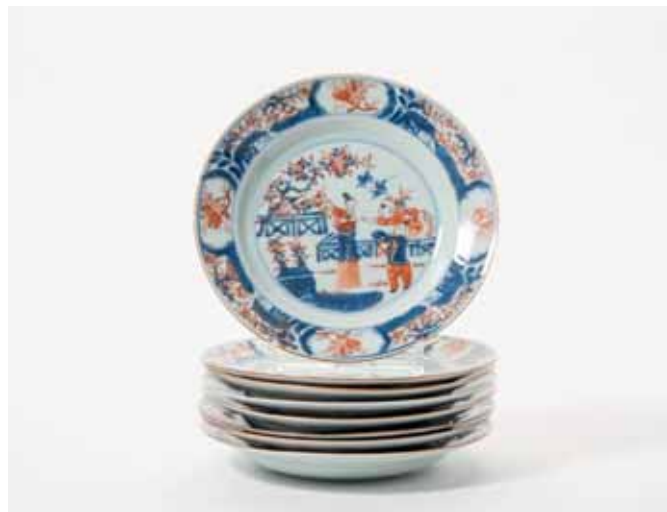
133 Een serie van acht Chinees Imari borden Qianlong Met een decor van een lange lijs en twee zotjes in een tuin. Diam. 21 cm (8x) € 600 - 1.000