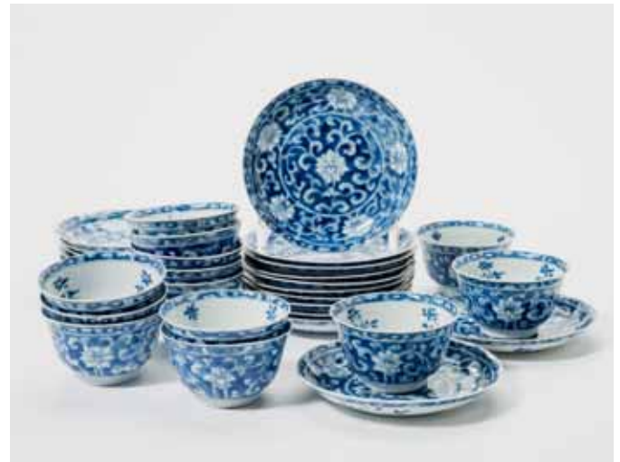
160 Een serie van dertien blauw-witte koppen en negentien schotels