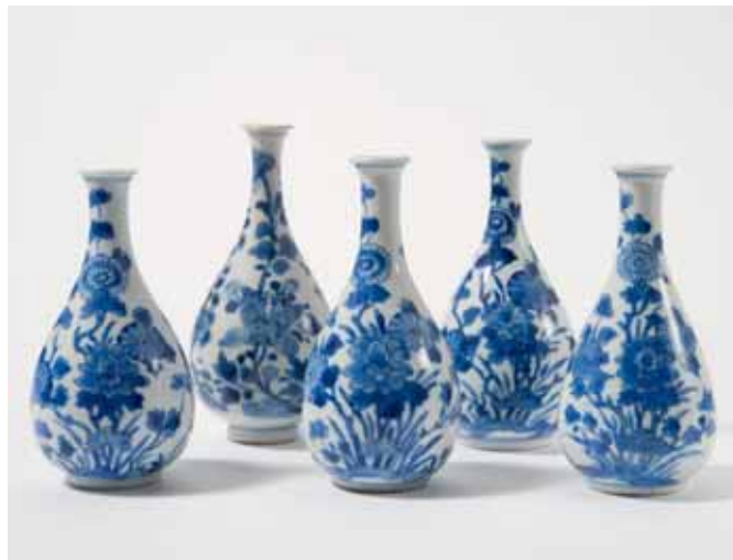
97 Een serie van vijf blauw-witte peervormige vaasjes