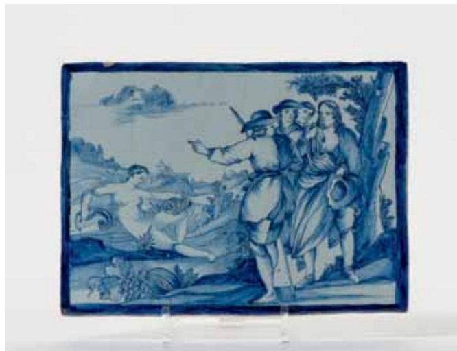
76 Een rechthoekige Delfts blauwe plaquette Derde kwart 18e eeuw Met een decor van vier staande figuren bij een waternimf, binnen een blauw kader. H. 21.5 x B. 29 cm € 1.200 - 1.500