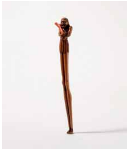
197 Een houten netsuke van Ashinaga als Zuidzee eilandbewoner Eind 19e eeuw Staand en gekleed in een rieten rok, de handen omklemmen een koraaltak, ogen en tanden van been, pupillen zwart ingelegd. H. 17 cm € 1.000 - 1.500