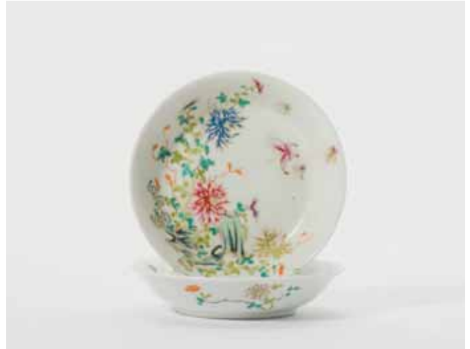
135 Een paar 'famille-rose' schaaltes China, 19e eeuw Beide met een decor van bloemen en vlinders bij een rots. Gemerkt Ju ren tang. Diam. 19 cm (2x) € 600 - 1.000