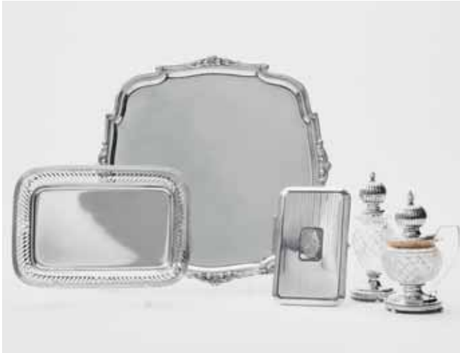
16 Een vierkant zilveren cabaret, een rechthoekig dienblaadje, een kristallen en zilveren strooier, een dito mosterdpot en een sigarettendoos

Amsterdam, A. Bonebakker & Zoon, 1878, Wed. J. Stellingwerff, 1842, P.G. Petersen, 1828, onbekende meester, 1824, Birmingham, 1938, J.W.B. Ld.