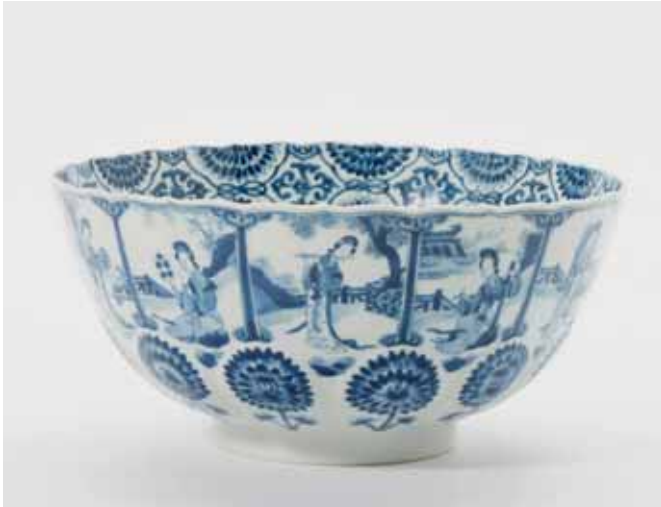
88 Een gebombeerde blauw-witte kom met gecontourneerde rand Kangxi Aan de buitenzijde vakken met een lange lijns boven een rij bloemtakken. In de bodem een lange lijns en een zotje. Gemerkt Chenghua . Diam. 24 cm € 2.000 - 3.000