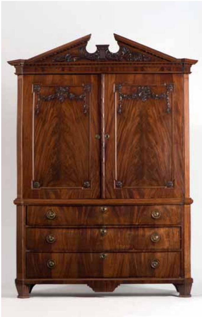
38 Een mahoniehouten Louis XVI kabinet Nederland, eind 18e eeuw

De kap met gebroken timpaan, onderkast met drie laden, op de deuren guirlandes aan een strik.