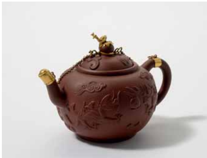
168 Een bolvormige Yixing theepot met deksel en verguld metalen monturen