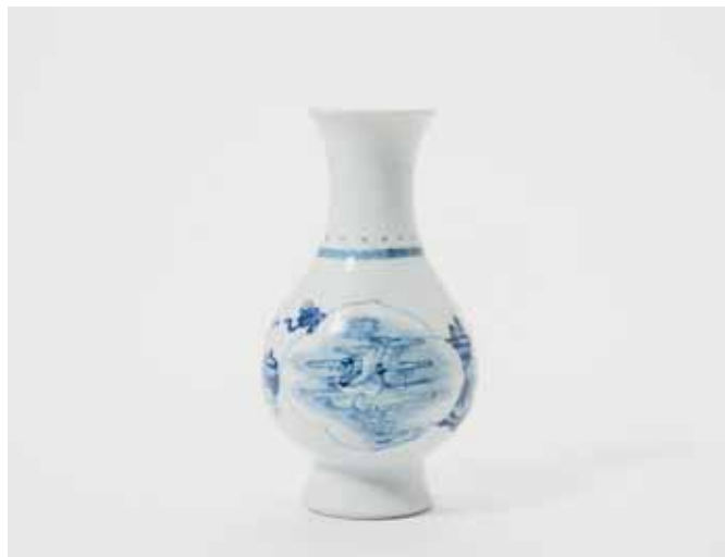
84 Een blauw-witte peervormige vaas met hoge, spreidende voet