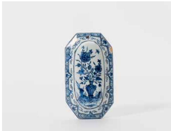
75 Een achtkantige Delfts blauwe borstelrug Gedateerd 1753 De gebogen bovenzijde met een decor van een vaas met bloemen bij een hek, langs de rand ruitmotieven en floraal patroon. L. 13.5 cm € 900 - 1.200