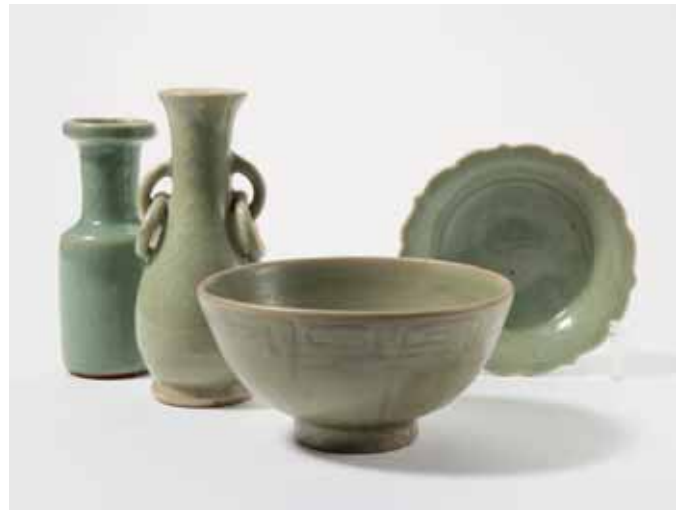
183 Twee Longquan celadon vaasjes, een kom en een schaalje