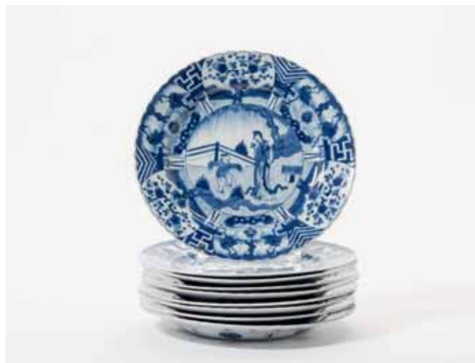
131 Een serie van negen blauw-witte borden met gegolfde rand China, 19e eeuw In het midden een decor van een lange lijs en een zotje bij een hek, waaromheen vakken. Diam. 23.5 cm (9x) € 600 - 800