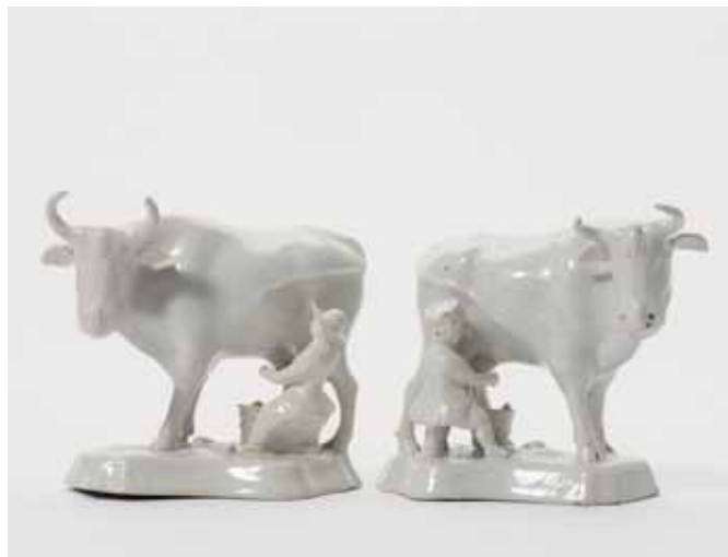
61 Een paar wit Delftse groepen

Diam. 14.5 / 23.5 / 24 / 30 cm (5x) € 600 - 1.000