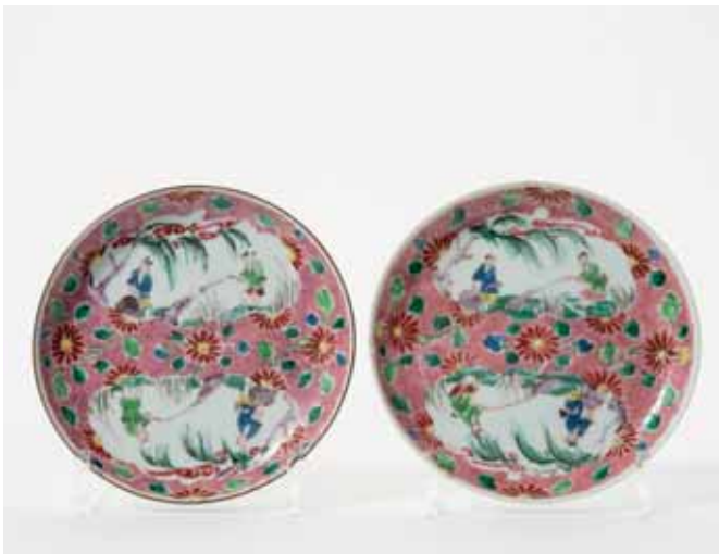
136 Een paar 'famille-rose' schaaltes Yongzheng Beide met een decor van twee bladvormige vakken met vissers. Eén met zeskaraktermerk. Diam. 16 cm (2x) € 600 - 1.000