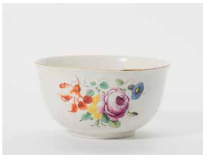
62 Een porseleinen Haagse spoelkom met spreidende rand

H. 18 cm Herkomst: - Veiling Christie's Amsterdam, 27 juni 2007, lot 51 - Particuliere collectie, Nederland (2x) € 1.000 - 1.500