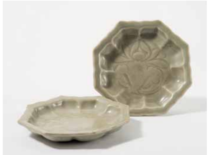
181 Een paar achtkantige celadon bordjes