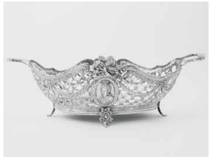
3 Een zilveren Louis XVI-stijl broodmand 19e/20ste eeuw, onduidelijk meesterteken Met twee grepen, de lange zijden met een medaillon aan een strik. Op vier gebogen pootjes. Gewicht ca. 1070 gram. L. 43.5 cm € 1.000 - 1.500