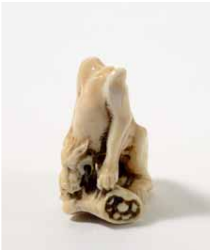
196 Een ivoren netsuke 19e/20ste eeuw Een zittende, uitgemergelde wolf die zijn tanden in een bout zet. H. 6 cm € 1.000 - 1.500