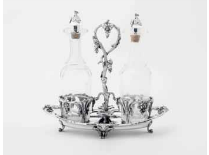
17 Een Frans zilveren en kristallen olie- en azijnstel