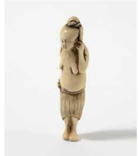
195 Een hertshoorn netsuke 19e eeuw Een staande duikster ( ama ). H. 7.5 cm € 600 - 1.000