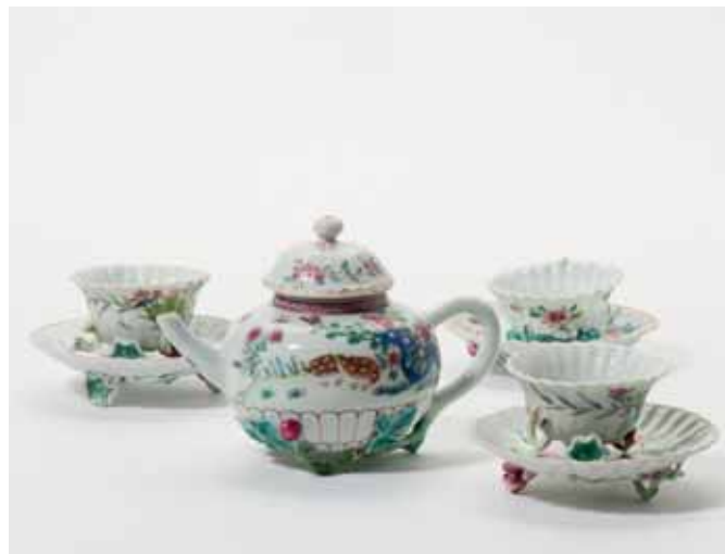
117 Een deels geribde 'famille-rose' theepot met deksel en drie koppen en schotels Qianlong De theepot met een decor van twee kwartels en pioenrozen bij een rots. Alle met takvormige pootjes. H. 11.5 / 3.5 - 4.6 / Diam. 11 cm (7x) € 800 - 1.200