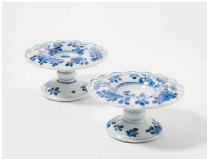
82 Een paar blauw-witte diabolovormige zoutvaten met gegolfde rand