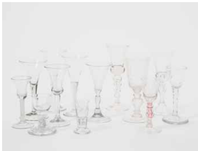
59 Dertien diverse glazen

18e/19e eeuw Eén met opschrift Roept Vivat Aen/Alle Kandt Tot/Oranien/In Holland , een glas met opschrift 'T Wel Vaaren Van Ons/Vaaderland , vier slinger-glazen, een Duits glas met radgravure, een 'Jacobite' glas met rode slinger en vijf diverse glazen.