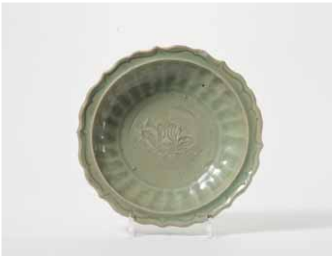
182 Een Longquan celadon schotel met gecontourneerde rand