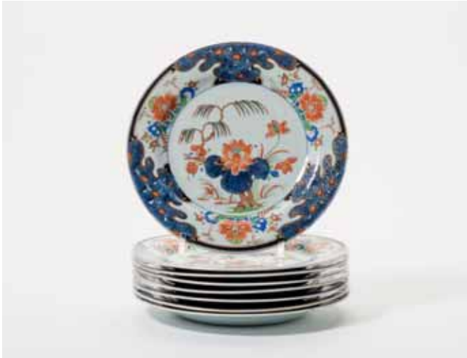
134 Een serie van acht Chinees Imari-verte borden Qianlong Met een decor van lotusbloemen bij een treurwilg. Diam. 23 cm (8x) € 700 - 900