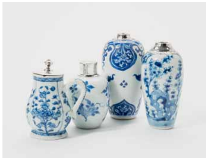
100 Een blauw-wit kannetje en drie vaasjes