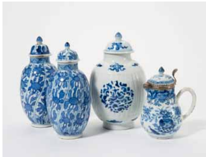
98 Een paar getorstte blauw-witte vazen met deksels, een geribde ei-vormige vaas met deksel en een melkkannetje met deksel