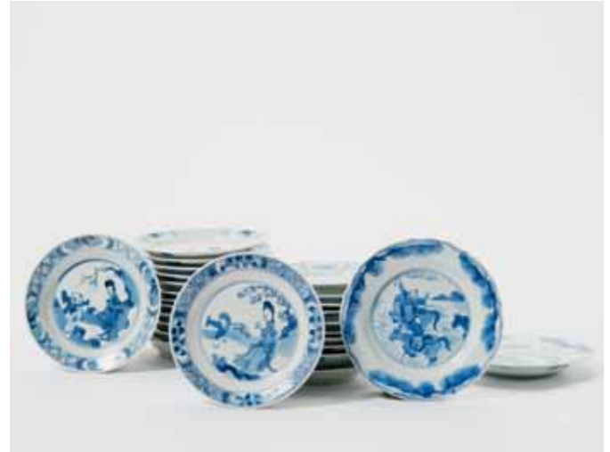
158 Vierentwintig blauw-witte schoteltjes en een paar met gecontourneerde rand