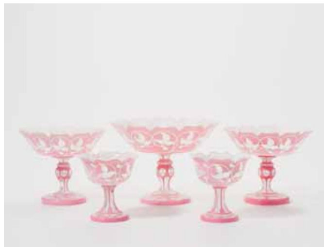
60 Een paar kristallen coupes, twee nagenoeg gelijke coupes en een grote bijpassende coupe

19e eeuw Alle met geschulpte rand, een roze überfang en slijpsel van gestileerde ranken.