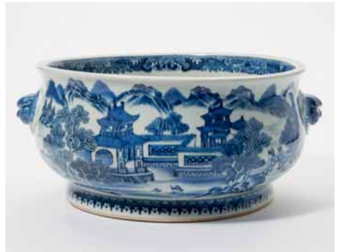
91 Een grote, massieve en ronde blauw-witte jardinière Qianlong Aan de buitenzijde een rotsachtig landschap met huizen en figuren op een brug. Grepen in de vorm van een masker. Diam. 44 cm Herkomst: Veiling AAG, Amsterdam, 14 oktober 2013, lot 144 € 1.500 - 2.000