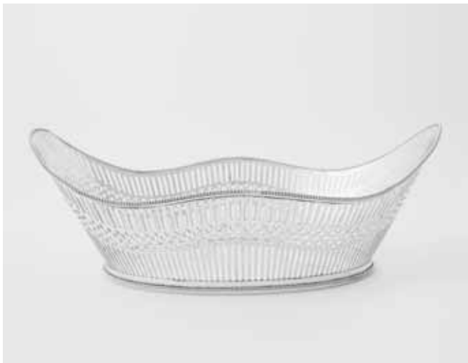
2 Een schuitvormige zilveren broodmand Schoonhoven, 1933, Gebrs. Seton Deels opengewerkt in spijlen. Met parelrand. Tweede gehalte, gewicht ca. 603 gram L. 34 cm € 700 - 1.000