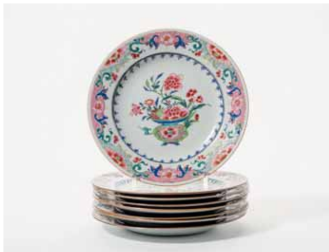
130 Een serie van acht 'famille-rose' borden Qianlong Met een centraal decor van een mand met bloemen, langs de rand servetwerk en pioenrozen. Diam. 22.5 cm (8x) € 600 - 800