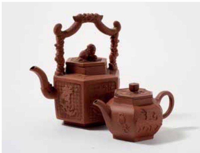
170 Twee zeskantige Yixing theepotten met deksels