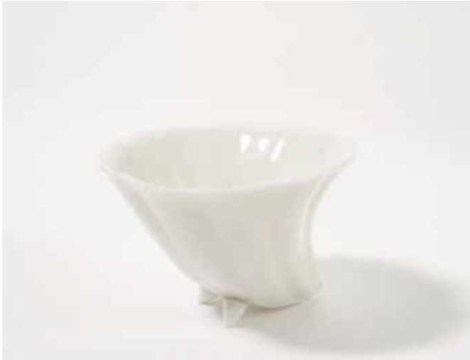
180 Een bloemvormige 'blanc de Chine' wijnkop