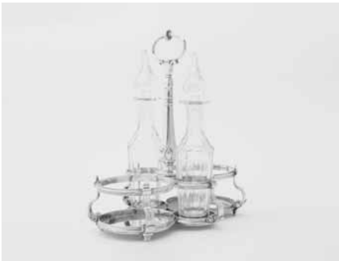
18 Een zilveren Louis XIV tafelstel