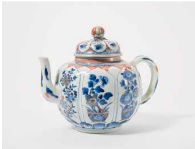
115 Een grote gebombeerde Chinees Imari theepot met deksel Kangxi Met een decor van acht lotusbladvormige vakken met bloemvazen en bloeiende takken. H. 19.5 cm € 1.500 - 2.000