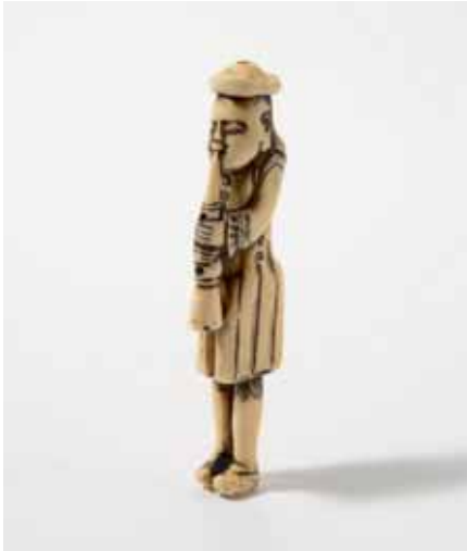
193 Een ivoren netsuke 19e eeuw Een staande Hollander met blaasinstrument. H. 7.7 cm € 600 - 1.000