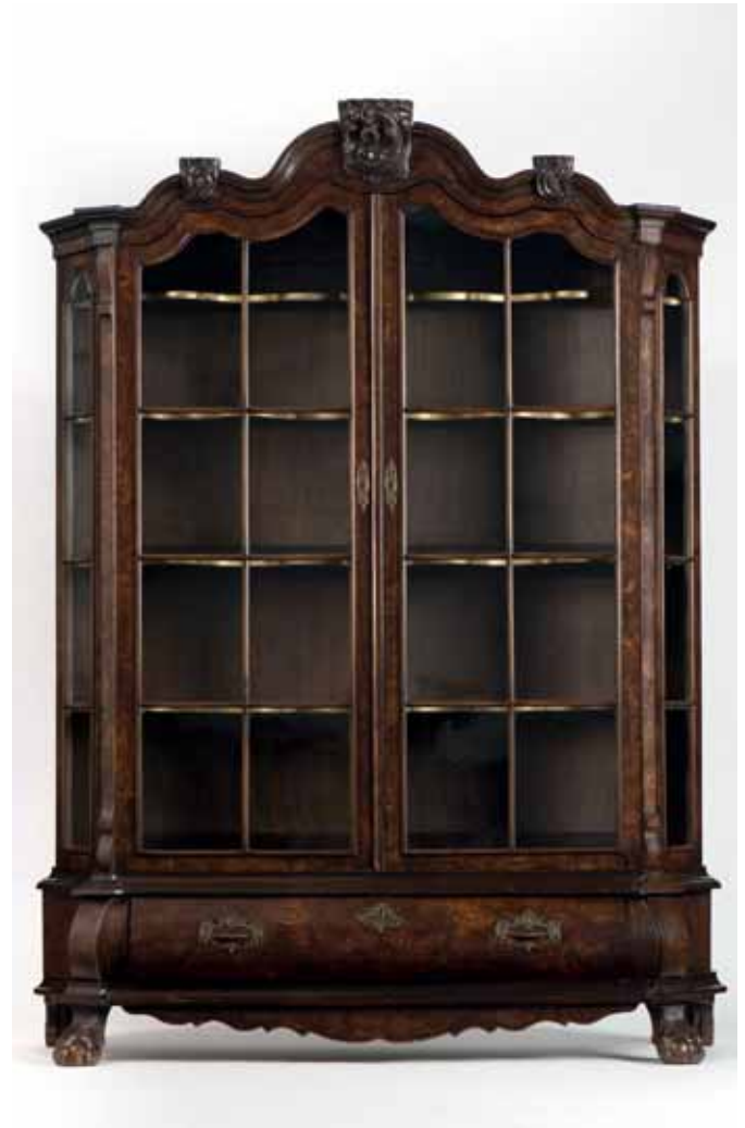
39 Een Louis XV-stijl wortelnoten houten tweedeurs vitrinekast 19e/20ste eeuw

De kap met drie rococo-stijl ornamenten, onder de deuren een gebogen lade.