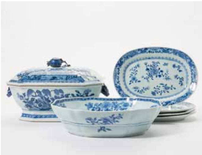
159 Een achtkantige blauw-witte terrine met deksel, een dito kom en een serie van vier ovale blauw-witte schotels