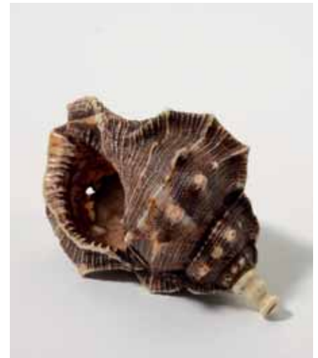
198 Een netsuke 19e/20ste eeuw In de vorm van een signaalhoorn ( horagai ) vervaardigd uit een kleine turboslak. Met draag-oog. L. 5.5 cm € 800 - 1.200