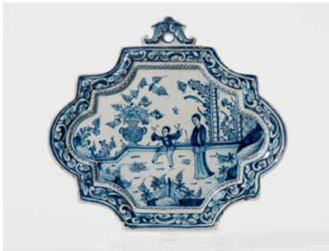
74 Een Delfts blauwe plaquette met geschulpte rand Circa 1740 Met een chinoiserie decor van een dame en een kind in een tuin. Langs de rand bloemen en ranken in spaartechniek. H. 22.5 x B. 25 cm € 900 - 1.200