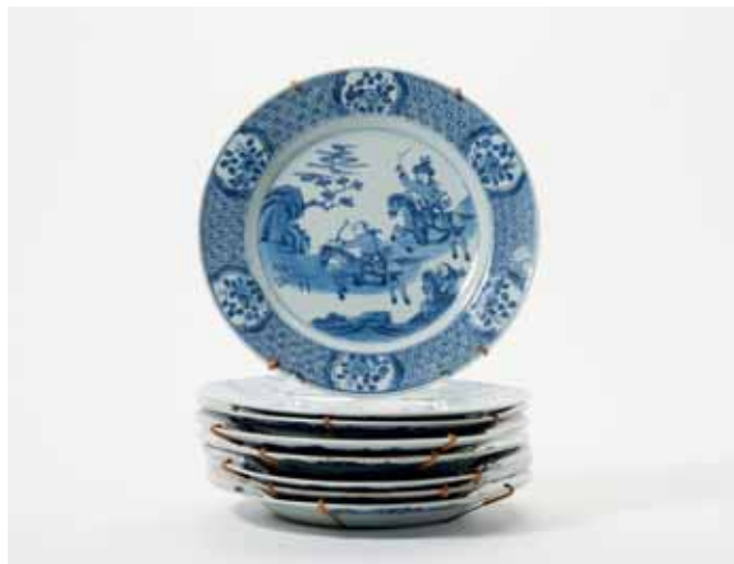
132 Een serie van acht blauw-witte borden Qianlong Met een decor van Joosje te paard. Gemerkt met schelp. Diam. 23.2 cm (8x) € 700 - 900