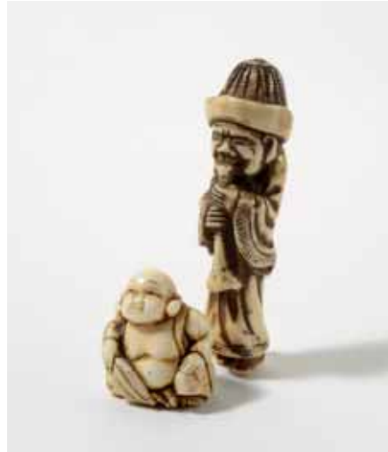
194 Twee ivoren netsuke 19e/20ste eeuw De eerste een staande Europeaan met blaasinstrument, de tweede een zittende Hotei met waaier. H. 7.6 / 3.2 cm (2x) € 600 - 1.000