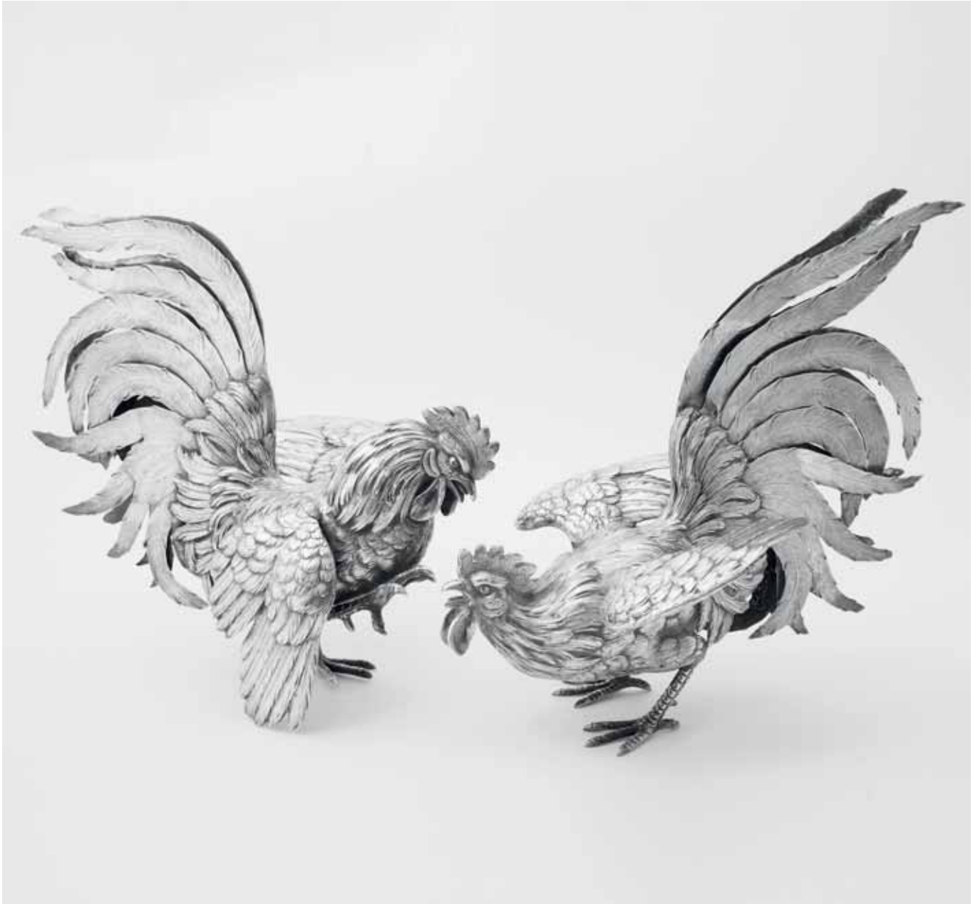
4 Een paar zilveren tafelstukken in de vorm van een haan 20ste eeuw Beide met uitgespreide vleugels, één met opgetrokken rechterpoot. Derde gehalte, gewicht ca. 1216 gram. H. 22.5 / 25 cm (2x) € 2.000 - 3.000