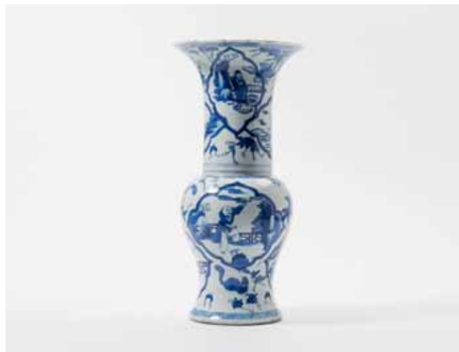
85 Een blauw-witte yenyen vaas