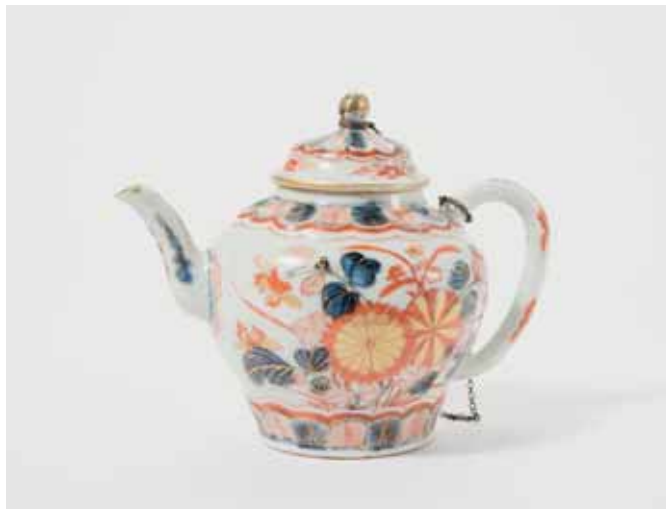
114 Een Chinees Imari theepot met deksel 18e eeuw Met een decor van bloemen tussen twee rijen bladeren in reliëf. H. 15 cm € 500 - 600