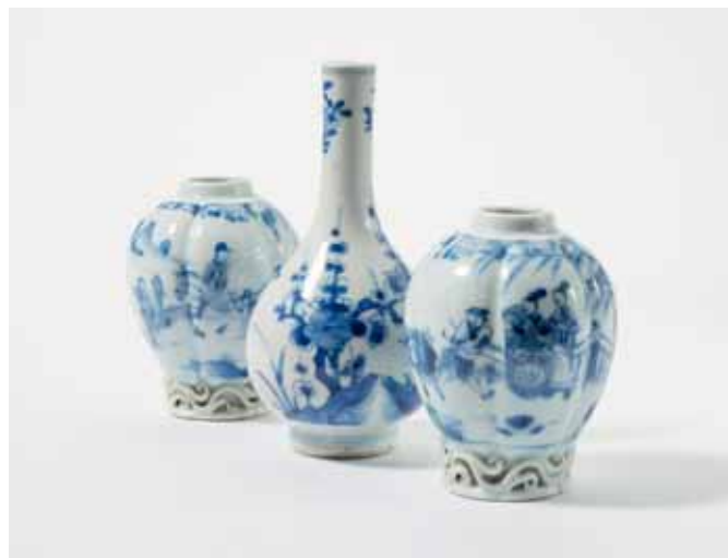
83 Een paar gebombeerde blauw-witte theebusjes en een peervormig vaasje