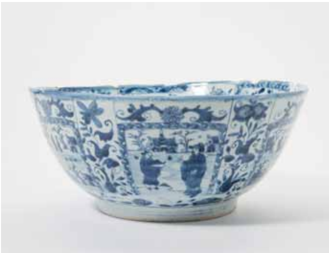
90 Een grote blauw-witte kom Transition Met een decor van landschappen met figuren en bloemtakken in perken. Diam. 34 cm € 1.000 - 1.500