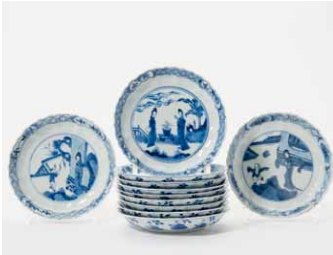
157 Een serie van elf blauw-witte gebombeerde schaaltes met gecontourneerde rand