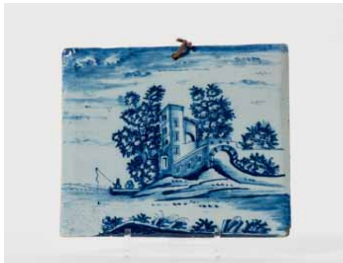
77 Een rechthoekige Delfts blauwe plaquette Circa 1780 Met een decor van een huis met toegangspoort tussen bomen, links een bootje met een hengelaar. H. 21.5 x B. 25.5 cm € 800 - 1.200