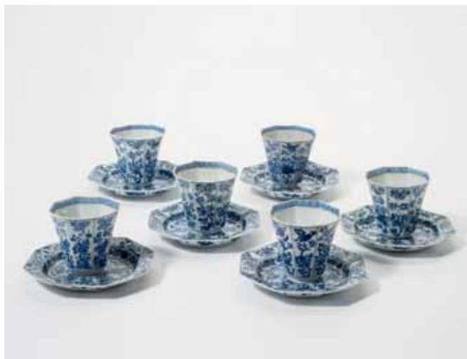
99 Een serie van zes achtkantige blauw-witte koppen en schotels